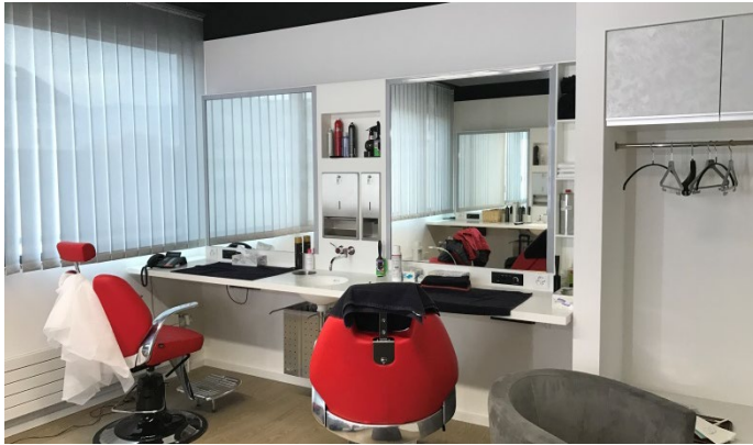
Nouveau local maquillage